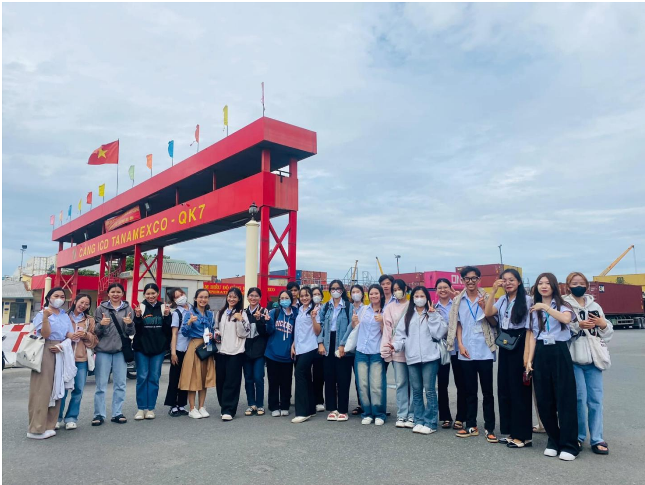
Ảnh: SV XNK tham quan các cảng Tân Cảng SJC và Taramexco