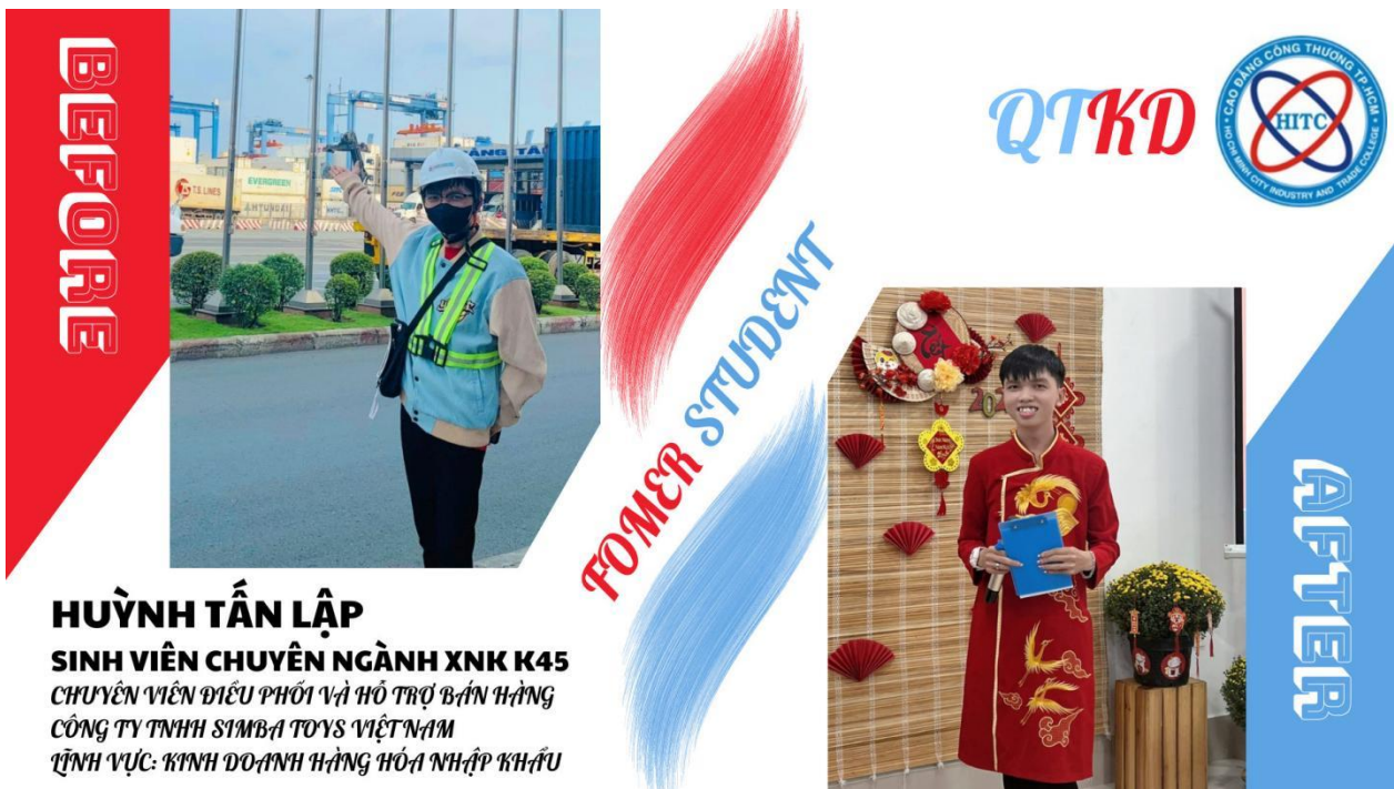
Ảnh: Cựu sinh viên XNK tham gia làm việc tại công ty XNK.