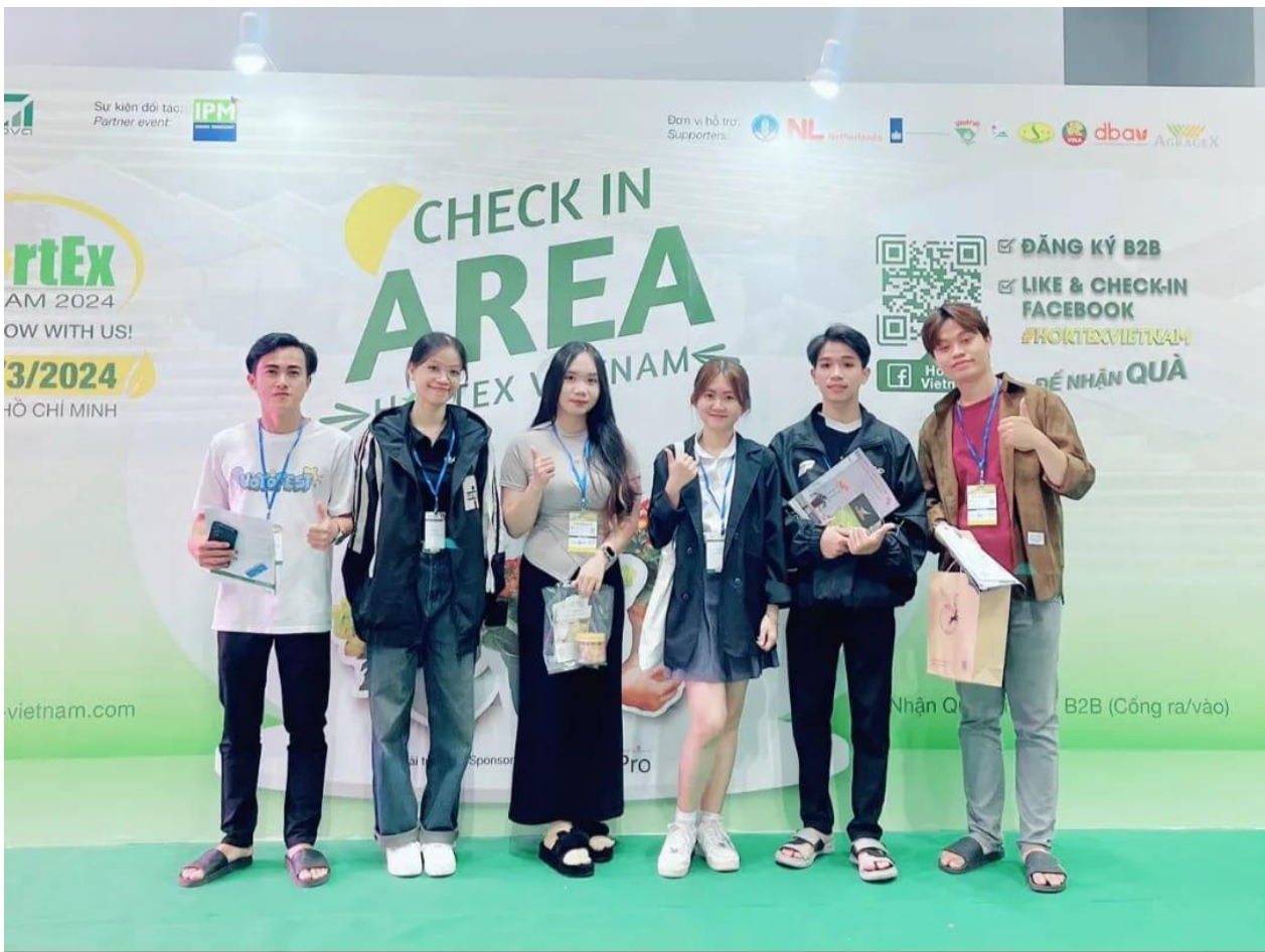
Ảnh: Sinh viên tham gia hội chợ triển lãm Quốc tế.