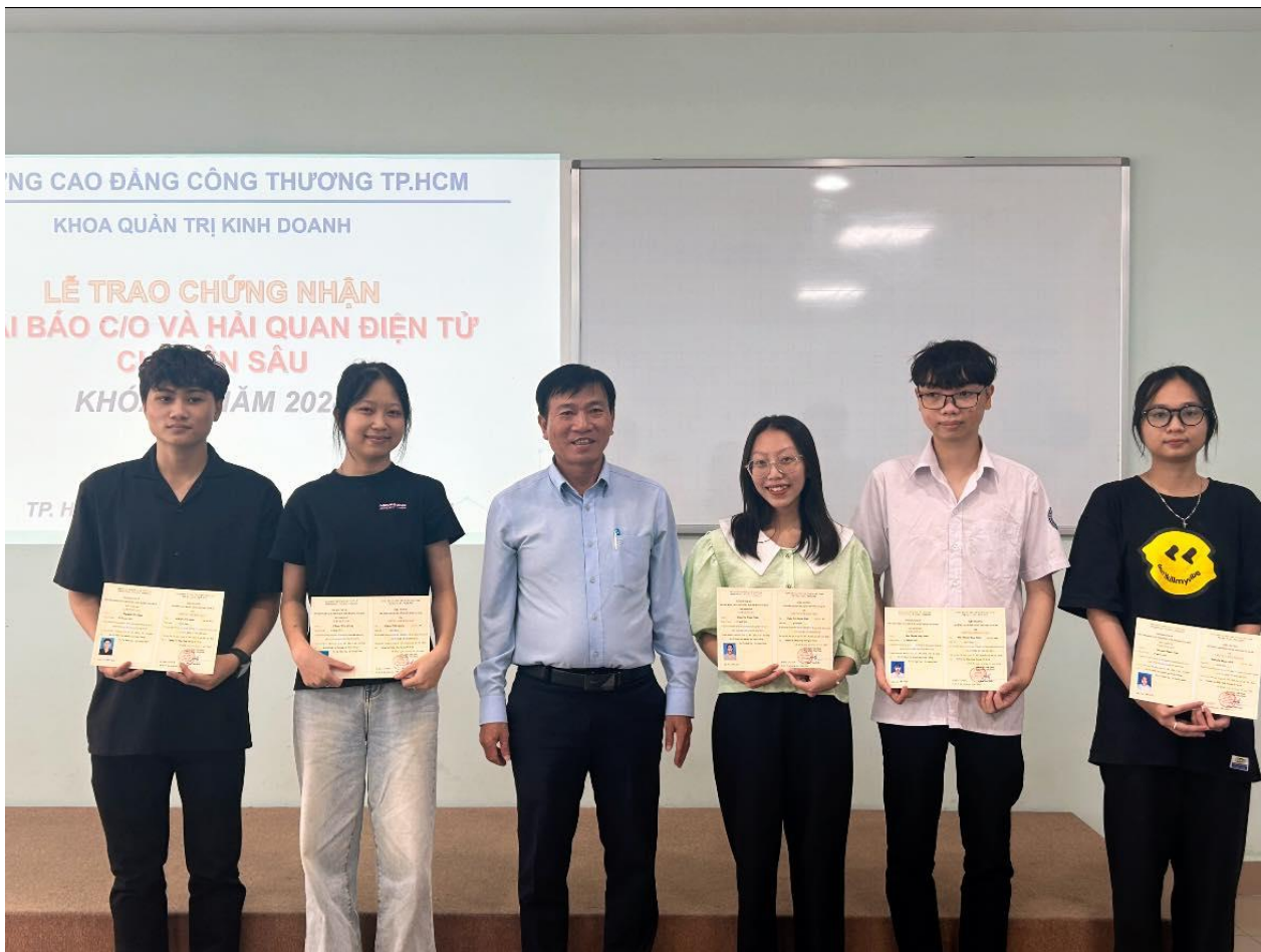
SV XNK nhận chứng nhận khóa ngắn hạn khai báo CO và hải quan điện tử.