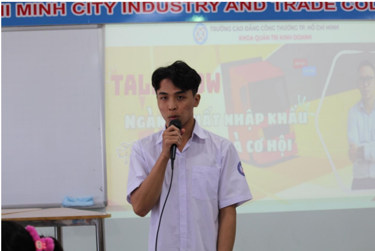
Ảnh: SV ngành XNK tham gia talkshow về ngành nghề.